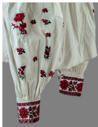
Koszula kobieca, Czerlany, ok. Gródka Jaگیellońskiegi, ok. 1930, autor haftu nieznanym