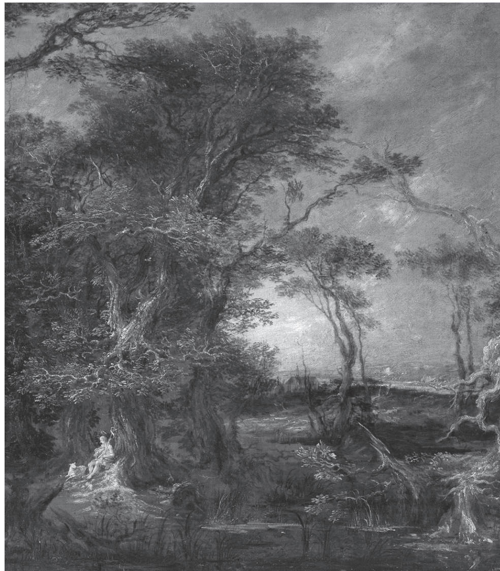
Michael Willmann, Pejzaż ze św. Janem Chrzcicielem , 1656 Muzeum Narodowe w Warszawie