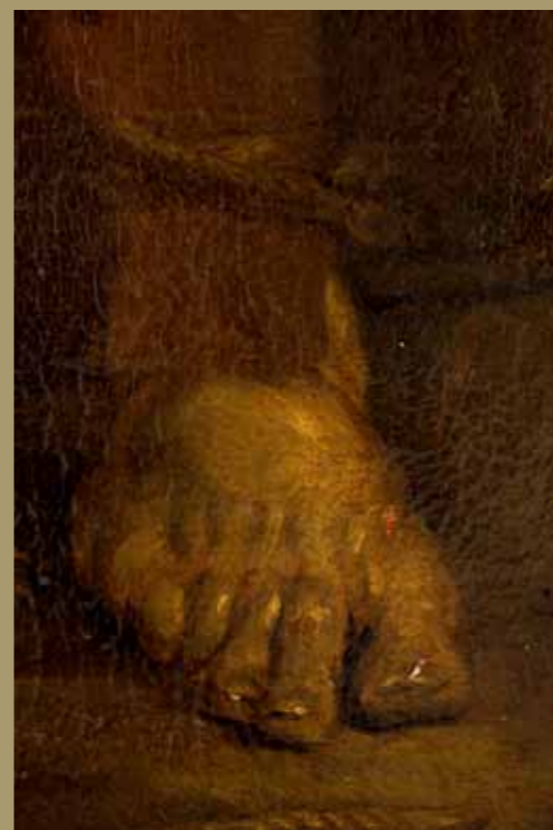
Pejzaż ze św. Janem Chrzcicielem, 1656 Muzeum Narodowe w Warszawie, nr inw. M.Ob. 1041 Pierwotnie w pałacu opackim w Lubiążu