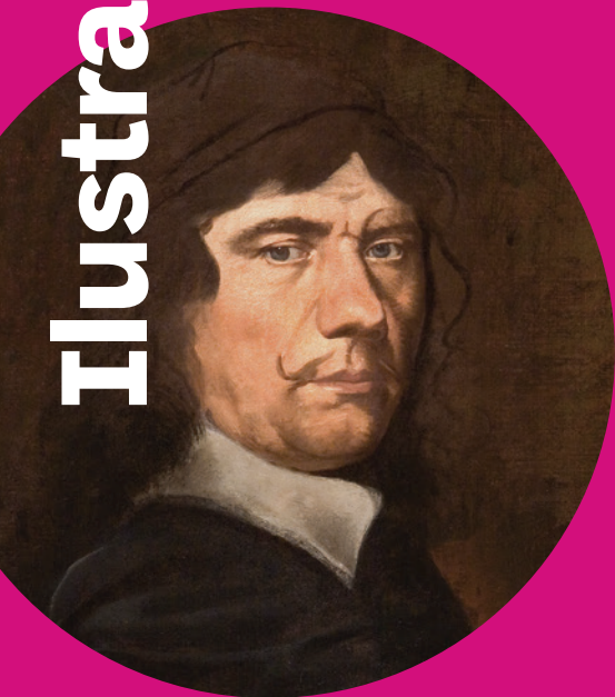
„Willmann. Opus magnum” 22.12.2019–26.04.2020 Michael Lucas Leopold Willmann, Autoportret , 1682