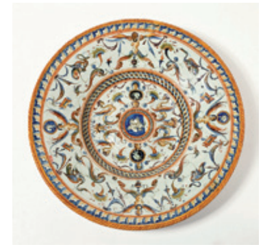
Majolika włoska, talerz, wytwórnia Patanazzi (?), ok. 1590, Włochy

kilku latach została na nowo zinterpretowana i oceniona. Wyniki tych analiz posłużyły prelegentom w świeżym spojrzeniu na postać i twórczy dorobek artysty.