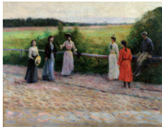
Władysław Podkowiński, Spotkanie , 1892