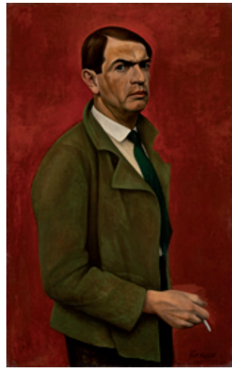
Alexander Kanoldt, Autoportret , 1929