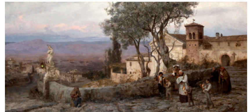
Henryk Siemiradzki, Z wiatkiem , 1889

Nowy cykl wykładów sobotnich poświęcony jednemu z wybitniejszych, znanych na świecie polskich malarzy akademickich – Henrykowi Siemiradzkemu. Jego twórczość badana w ostatnich