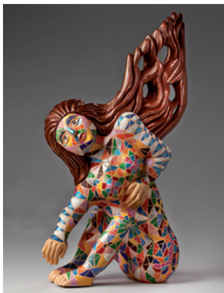
Jan Koloczek, Mozaika , 2015