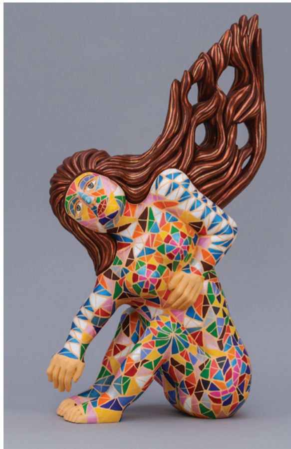
„Jan Koloczek – malowane marzenia” Jan Koloczek, Mozaika , 2011, Nysa, rzeźba polichromowana, drewno, farby akrylowe