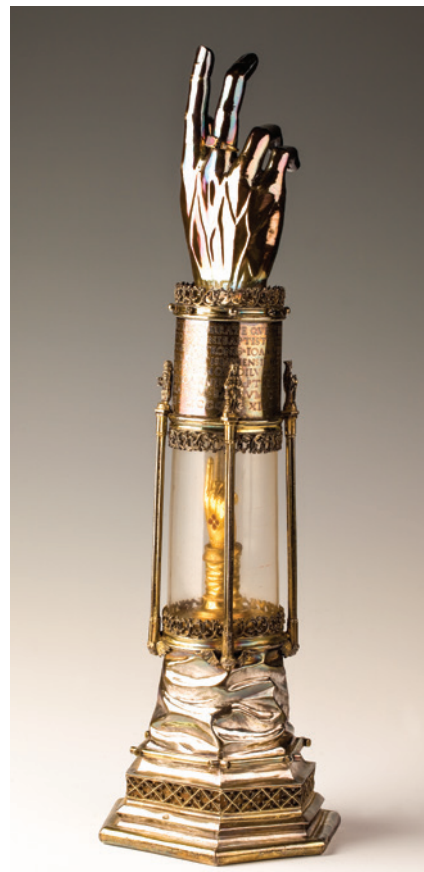
„Miśracje Sztuka późnogotycka na Śląsku”