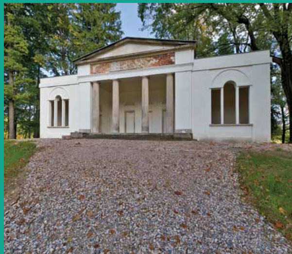
Herbaciarnia w Bukowcu

realizowanej w XIX w. wizji „Śląskiego Elizium”. Region ten jest coraz bardziej znany z największego nagromadzenia pałaców, co stanowi jego wyróżnik na wielokulturowej mapie Europy. Zapraszamy Państwa do odwiedzenia pałaców będących kamieniem milowym początkującym rozwój Kotliny Jeleniogórskiej takiej, jaką znamy w dniu dzisiejszym.