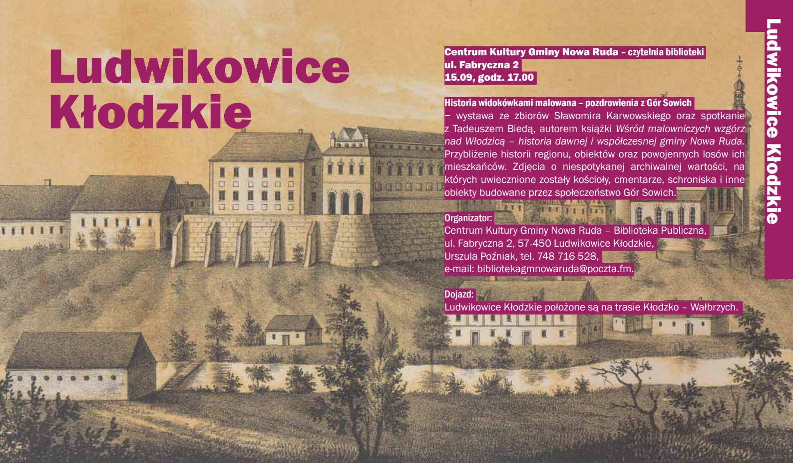
Schloss und Kirche zu Neurode i. J. 1739.

Ludwikowice Kłodzkie położone są na trasie Kłodzko – Wałbrzych.